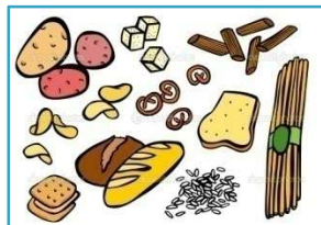
Cereals i fècules